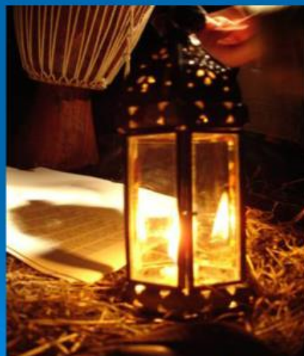
Américo Nunes Peres